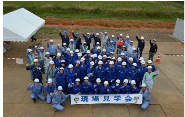
現場見学会 (高所作業車から集合写真)